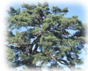
ふるさと敦賀の木「まつ」