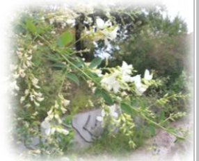
ふるさと敦賀の花「はぎ」

「白砂青松」の地である敦賀を愛し、郷土の発展に貢献する活力ある人材を育成するため、家庭・学校・地域が一体となって、先人が築き上げた伝統を受け継ぎ、「人道の港」敦賀ならではの魅力ある教育を推進する。