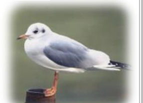
ふるさと敦賀の鳥「ユリカモメ」