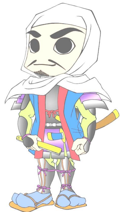
敦賀市公認キャラクター「よっしー」